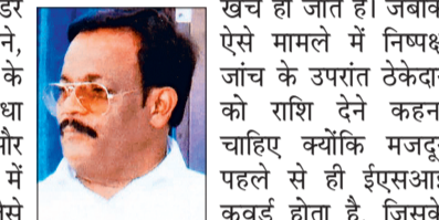
विभिन्न मुद्दों पर होगी चर्चा