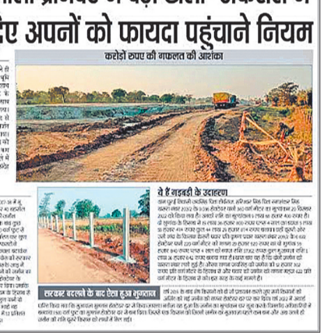
भारत माला प्रोजेक्ट में बड़ा खेला- अफसरों ने बदल दिए अपनों को फायदा पहुंचाने नियम